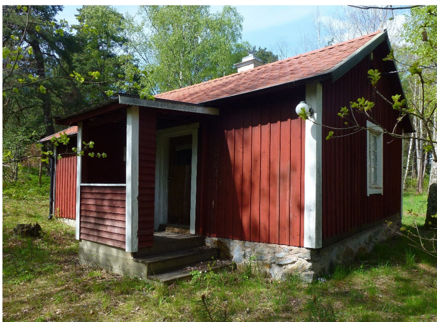
Torpet Sörntorp.