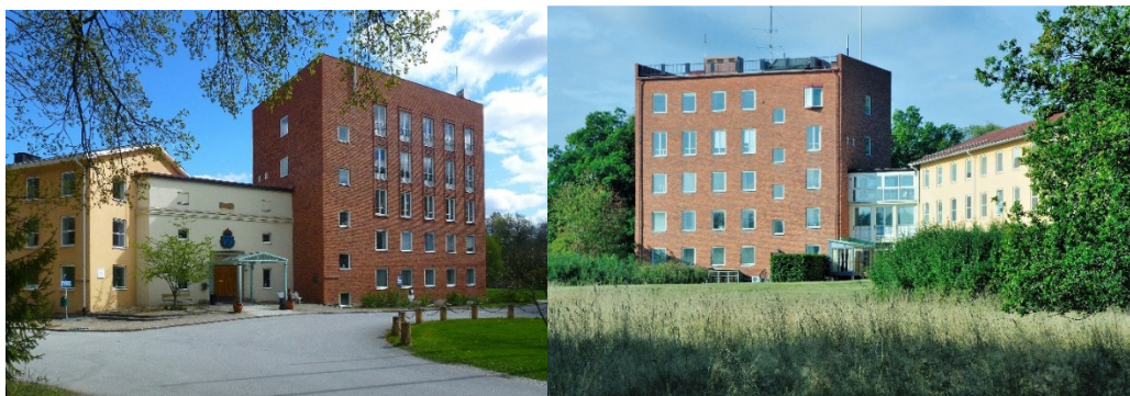
Kanslihuset från två håll

I kanslihusets stabsdel inrymdes regementsstaben och i dess förvaltningsdel fanns personalavdelningen, tygmaterielavdelningen, intendenturmaterielavdelningen samt mobiliseringsavdelningen. I stabsdelen har en påbyggnad skett – utöver den ursprungliga planen - med en våning för officersmatsalen. Officersmässen var inrymd på tredje våningen. Honnörssalen låg på andra våningen där sekundchefen också hade sitt tjänsterum. Dagofficeren disponerade två rum på nedre botten, varav ett sovrum.