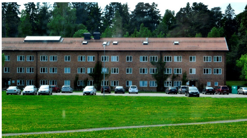
Kompanikasern – studentkompaniet, men alla kasernerna var likartade