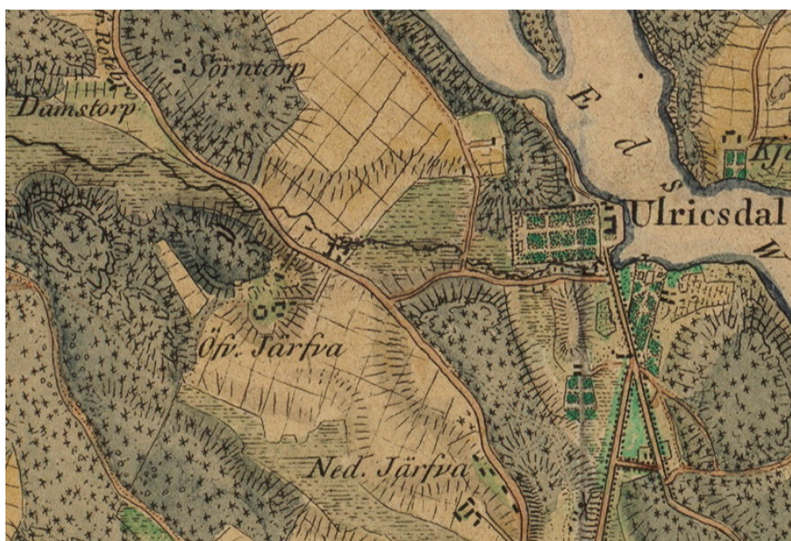
Karta där man ser Sörntorp i NV delen.