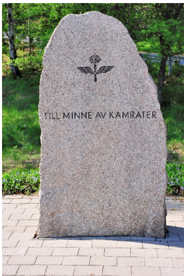
Minnesstenen nedanför kanslihuset

F18 Kamratförening, som bildades år 1984, arbetar och har arbetat aktivt för att hålla flottiljens historia levande. Stödet från kommunen (numera Tullinge kommun) har inte varit det bästa. Kamratföreningen har och kompletterar ett omfattande material på sin egen hemsida ( www.f18.se ) och på Wikipedia. F18 kamratförening har givit ut en bok om flygvapnets område i Tullinge, om Kungl. Södertörns flygflottilj och Flygvapnets Södertörnsskolors verksamhet. Boken beskrivs och kan beställas på kamratföreningens hemsida.