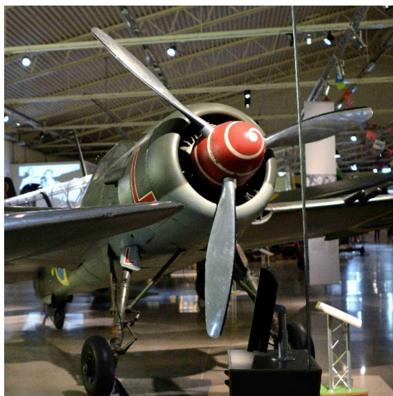
Den första flygplanstypen på F 18, J 22