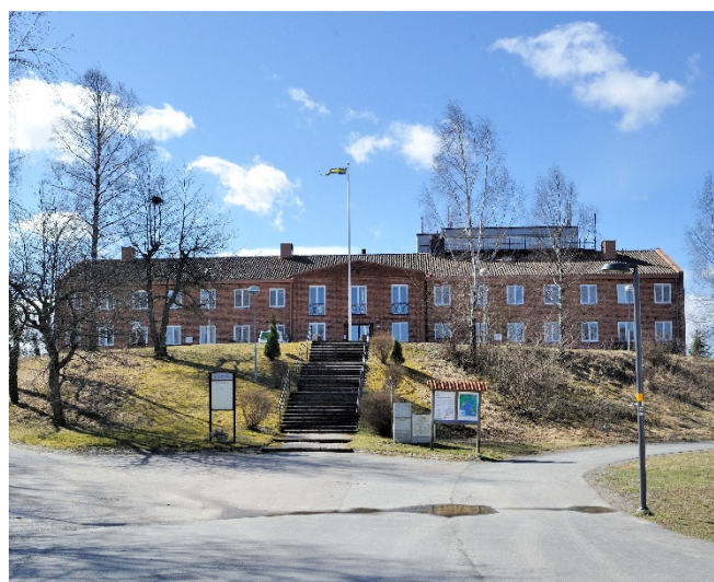
Kanslihuset med flygledartorn

År 1974 var flottiljens sista verksamma år, de två kvarvarande divisionerna hade avvecklats året innan. Först hade 181.jaktflygdivisionen avvecklats i juni 1974 och sedan 183.jaktflygdivisionen den 31 december 1973. Utbildnings- och specialkompaniet överfördes till det nya skolförbandet, som fick namnet Utbildningskompaniet. I samband med nedläggningen av F 18 som jaktflygflottilj invigdes Flygvapnets Södertörnsskolor. Uppgiften för skolorna var att utbilda värnpliktiga, framtidens officerare och civil personal för Flygvapnet. Efter nedläggningen 1986 bedrevs militär verksamhet fram till 1996.