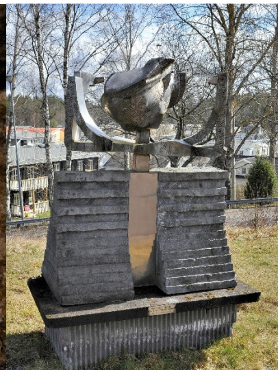
Radarns hemlighet framför kanslihuset. Skulptör Tommy Widing, gåva av Nya Asfalt AB 1975