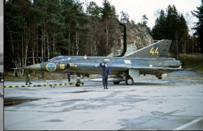
J 35 B