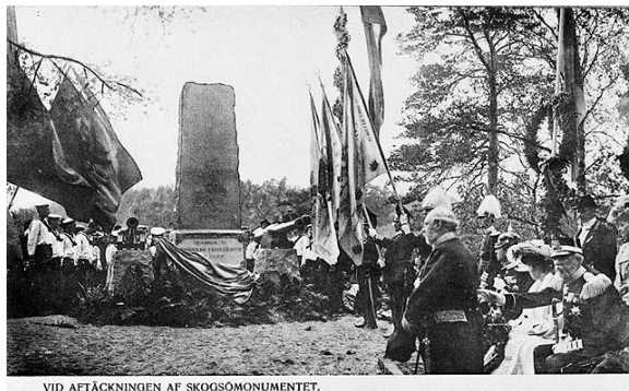
VID AFTÄCKNINGEN AF SKOGSÖMONUMENTET.

Under den nationalromantiska eran restes mängder med monument runt om i landet för att påminna befolkningen om storslagna dagar. Så var även fallet med slaget vid Baggensstäket då Föreningen för Stockholms fasta försvar uppförde en fyra meter hög minnessten i röd grovkornig granit alldeles ovanför ångbåtsbryggan på Skogsö i Saltsjöbaden.