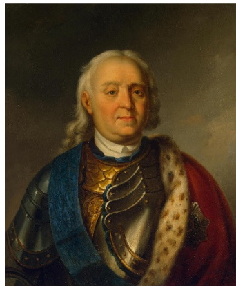
Amiral Fjodor Apraksin.

Regementet löste sin taktiska uppgift att hindra de ryska soldater som landstigit på Skogsö från att röja sundet från försänkningar innan svenska förstärkningar anlände. Totalt tillfogades den ryska styrkan fyra gånger högre förluster än de egna. Det kanske inte är så ärofyllt att "ställa sig i vägen" för ryssen, jämfört med tidigare beskrivningar av slaget där fienden kastades i havet av ett regementsanfall, men det var vad som var möjligt med gällande styrke- och tidsförhållanden.