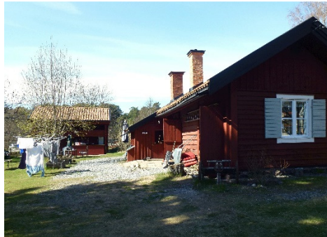
Pungpinan idag.