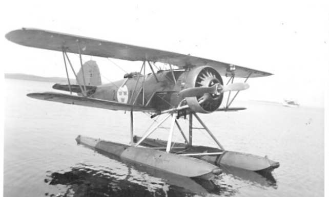
Hawker Osprey / S 9 (H) (6 st på Hägernäs) med flottörer, för flygplankryssaren Gotland, Flygvapenmuseum