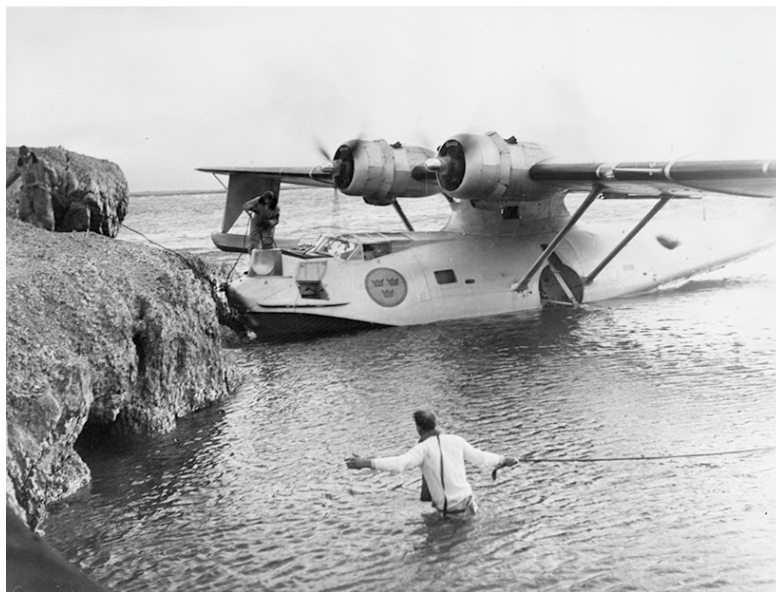
Tp 47 Catalina på uppdrag i skärgården.