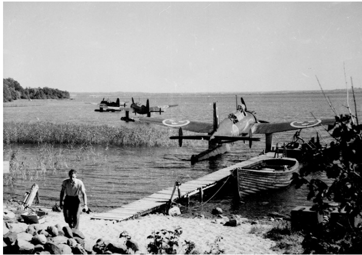
Saab 17 BS lägger ut från Högernäs.