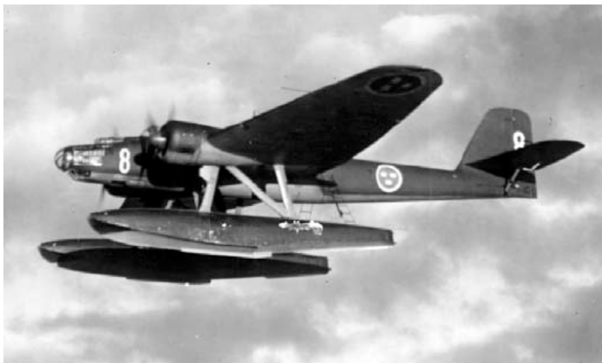
T2, Heinkel 115A kunde bära torpeder, bomber, livbåtar (12 stycken på Hägernäs)