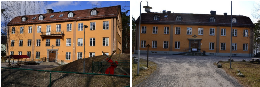
Kanslihuset (från söder respektive norr) är till det yttre oförändrat, men inrymmer nu bland annat en förskola.

Genom att kanslihuset och många kasernbyggnader har bevarats i nära ursprungligt skick kan man lätt föreställa sig hur flottiljen tedde sig under sin verksamma tid. Man kan säga att området har "förtätats" med nya hyreshus, skolor, radhus och kontor mellan och runt de ursprungliga flottiljbyggnaderna.