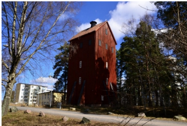
Vattentornet från år 1929 med den nya stadsdelen ned mot Värtaviken.