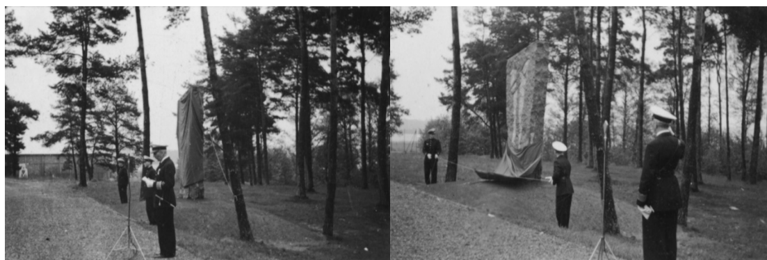
Från invigningen.