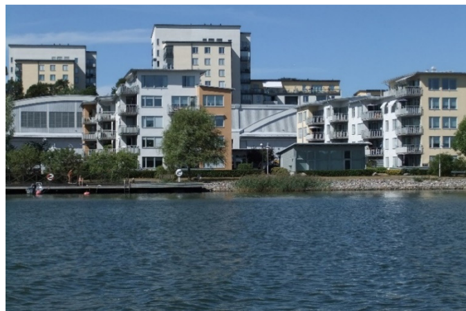
Hangarerna syns bakom husen i den nya stadsdelen Hägernäs, Foto: Jan Forsberg

Man har lyckats väl med såväl stadsplanen som den nya bebyggelsen på flottiljområdet. Flottiljens historiska karaktär har bevarats i stor utsträckning och bidrar till att göra området exklusivt. Stadsdelen har egna kvaliteter som Garnisonsminnesföreningen inte har hittat hos de andra nedlagda stockholmsflottiljerna. Det har ju dessutom inte funnits några start- och landningsbanor att riva upp.