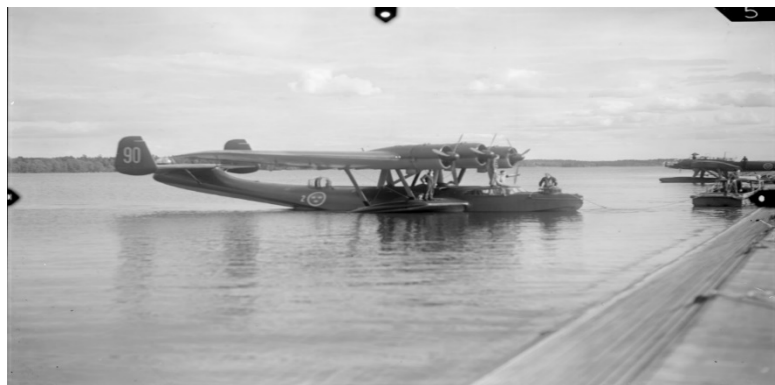
Det tremotoriga Tp 24 Dornier på slipen. Dornier Do 24T-3 flögs till Sverige av tysk flyktning 1944 och hade då bara tolv flygtimmar. Det var i aktiv tjänst vid F2 till augusti 1951. Den tyske piloten anställes senare som mekaniker på F2.