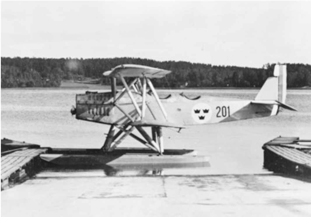
Friedrichshafen FF 33/E/Sk2 Foto Flygvapenmuseum. Sex stycken tillhörde Hägernäs.

Marinens Flygväsende (år 1911 – 1926) hade knappt tio flygplantyper stationerade på Hägernäs. Under Flygvapentiden var drygt 20 flygplantyper stationerade på Hägernäs. Ett representativt urval visas nedan.