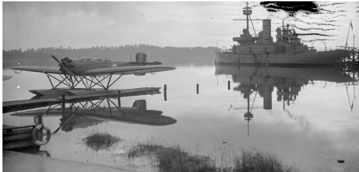
Heinkel Hansa S5 på slipen år 1933 och nedan. 40 stycken tillhörde Hägernäs. HMS Göta i bakgrunden.