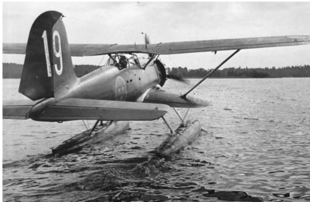
Heinkel He 114A / S 12. (12 stycken på Hägernäs). S12 var en blandning mellan ett biplan och ett monoplan (se den mindre undervingen) och hade tveksamma flyg- och sjöegenskaper.