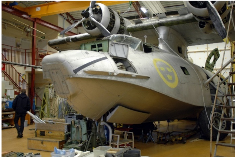
Den Catalina som flögs till Malmslätt år 1966, under renovering på Flygvapenmuseum år 2009. Den är nu utställd på museet, bilden nedan.