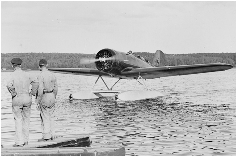
Charles Lindbergh besökte Hägernäs de 4 september 1933. Han flög en Lockheed 8 Sirius. Fru Lindbergh sitter i baksits.