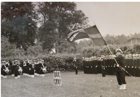
Krigsmans erinran 1956