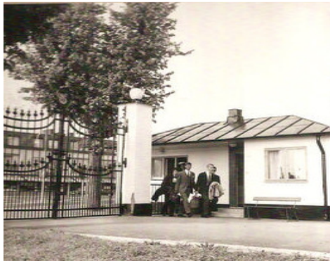
Aspiranter passerar Vakten vid KSS