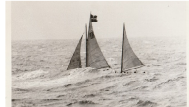
Livbåten under segel