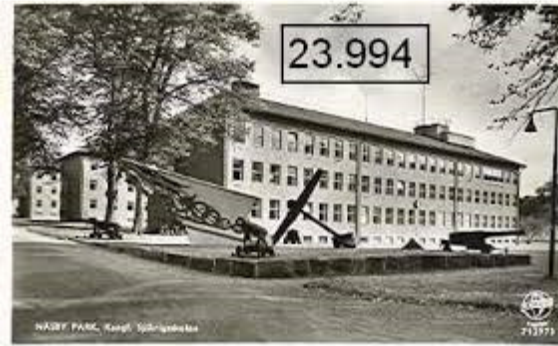
Skolbyggnad, två kaserner och exercisplan