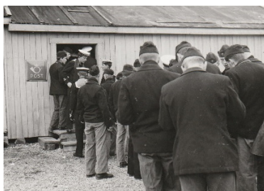
Kö för att posta hälsning hem