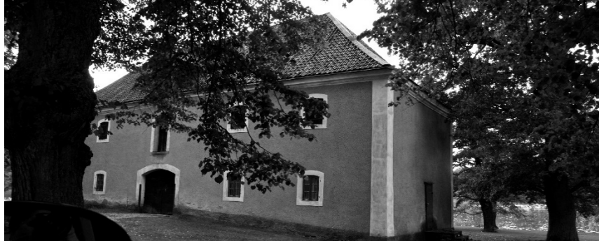
Slottets stall som var förråd av olika slag