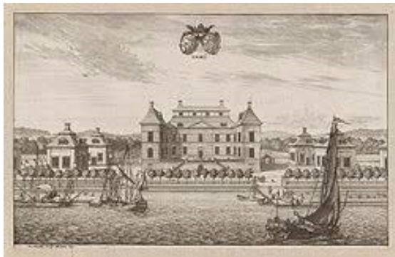
Näsby Slott på 1500-talet