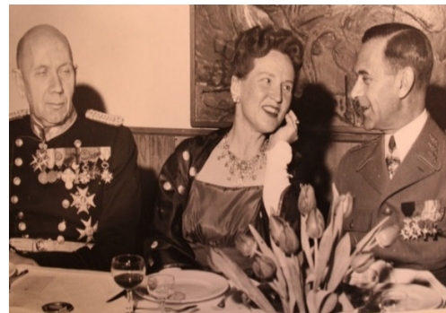
Inbjudna gäster av alla de slag