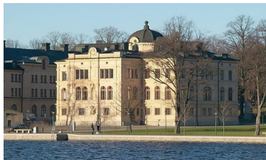
Sjökrigsskolans på Skeppsholmen 1878 – 1943