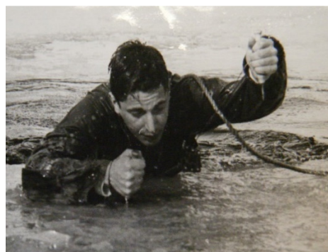
Kadett Hoff övar uppgång ur vak