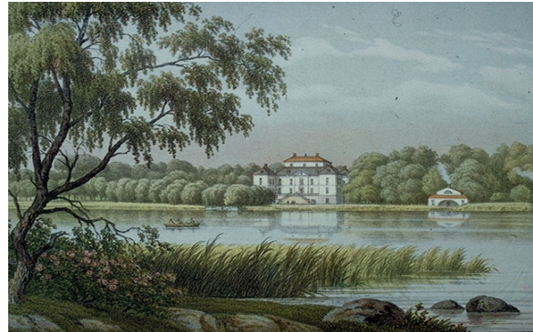
Näsby Slott på 1800-talet

Slottet ligger vid Näsbyviken, som är en vik av Värtan innanför Vaxholm och Askrikefjärden norr om Lidingö.