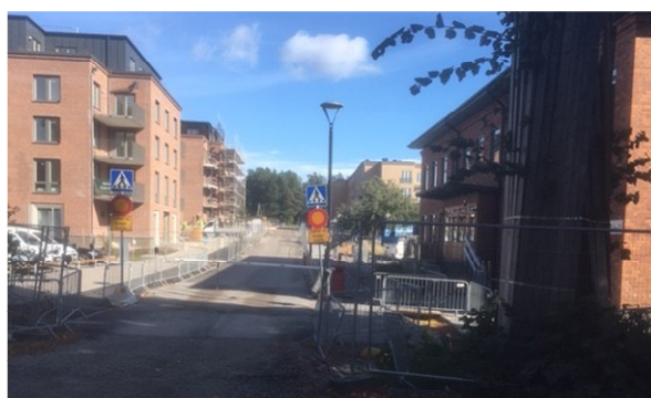
Fastigheter under byggnad med den gamla kadettmässen längst till höger

Vissa foton tagna av Thomas Eckered 2017 och av mig 1964 och 2020. Andra är klippta ur boken nämnd ovan och vissa andra är kopierade av mig från album i Krigsarkivets samlingar under åren 1956–1959. Några är kopierade från Google våren 2021.