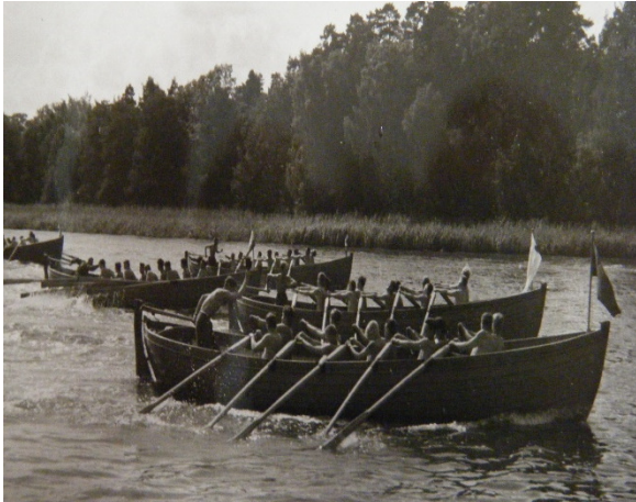
Tiohuggare under tävling på Näsbyviken