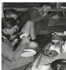
Skaffning på durken

Långresan avbröts redan efter besöket i Cadiz på grund av Suezkrisen, då Älvsnabben beordrades återvända hem till Sverige. Efter tullkontroll den 16 november i Göteborg, så var den resan avslutad. Sedan gick vi till våra nordliga hamnar och väntade på möjlighet att få starta vår nu avkortade resa till Västindien. Vi fick order att gå till Nya varvet 8 januari för kompletteringar och den 10 januari klockan 1000 startade vår långresa till Las Palmas, La Guaira, Guantanamo Bay, Vera Cruz, Lobos Islands, Havanna, Leixoes och åter till Göteborg 3 april. Utbildningen bestod i astronomisk navigation med hjälp av sextant, teorilektioner av allehanda slag, gymnastik samt fartygsunderhållsarbeten. Livet ombord, då det gungade kraftigt kunde innebära skaffning med backlagsbordet vänt upp och ned.