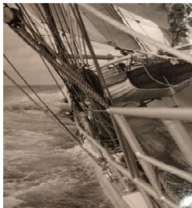
Gladan seglar för styrbords halsar