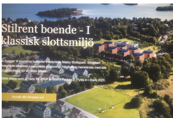
Silver Life äldreboende gör reklam för intressenter

I bakgrunden ses gymnastikhallen, som kanske skall rivas sedan Friskis & Svettis blivit uppsagda från och med juli 2021. Planen för kommande utbyggnader framgår av bilden nedan.