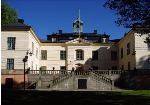
Slottet från sydväst