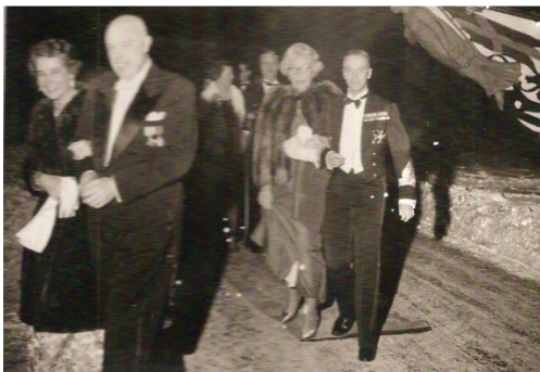
Från kadettmässen till slottet och dansen