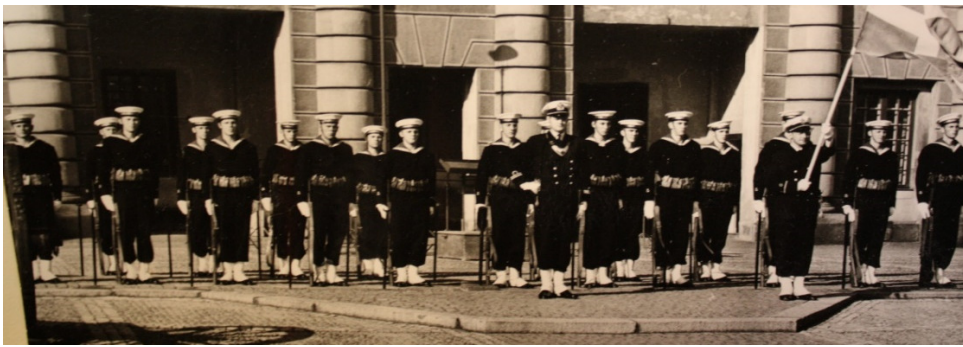
Högvakt vid Slottet 1956

Exercis utan och med vapen, gymnastik och idrott, skjutning med kpist, teoretisk vapen-, navigations- och organisationslära, ordning och reda samt vett och etikett. Högvaktenens genomförande i augusti utgjorde kulmen på exercisutbildningen.