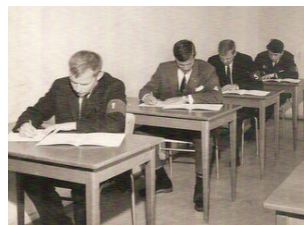
De får skriftliga frågor