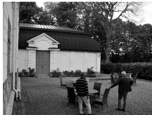
Slottets tavelgalleri som blev skolans aula