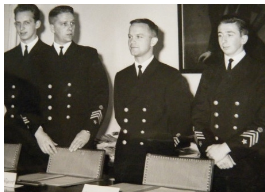
Examensförhör med fyra thailändska kadetter och fyra intendentkadetter

Under examen förhörs eleverna i tre olika ämnesområden under ledning av tre olika kadettofficerare. Jag upplevde inte att någon kuggades på examensdagen. Däremot var det några som tog avsked efter fänriksutnämningen och började studier på andra högskolor. Vi visste att vi nu började vår första officerstjänstgöring med ”fänriksåren” , där vi noga granskades av särskilt utsedda officerare, för att vi skulle kunna utnämnas till löjtnanter efter två år. Förr om åren var det då den nybefodrade löjtnanten fick ett intyg av Konungen att han var officer på riktigt.