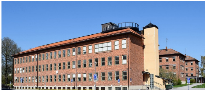
Tillbyggnad för kadettofficerare m. fl. Skolbyggnad och kasernerna Fylgia och Borgen

Det hade byggts en skolbyggnad och två kaserner för 240 kadetter i dubbelrum (Fylgia för sjökadetter och Borgen för kustartillerikadetter) och en exercishall.