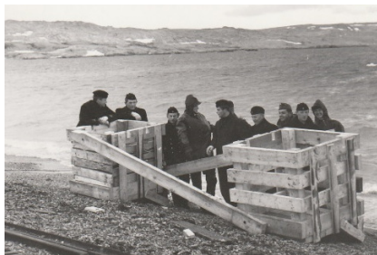
Bygga stöd för en kaj