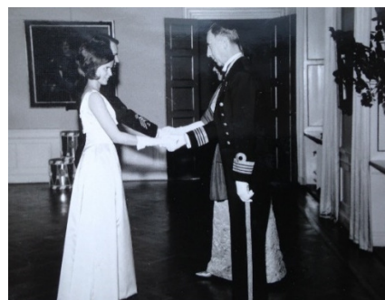
Skolchefen hälsar elever med dam välkomna