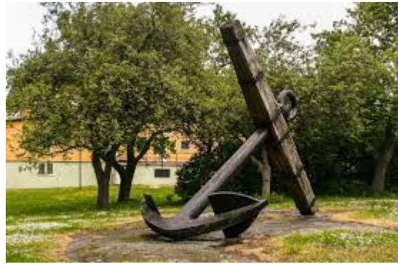
Ankare med Gymnastikhallen i bakgrunden