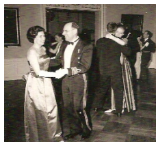
Souschefen har bjudit upp