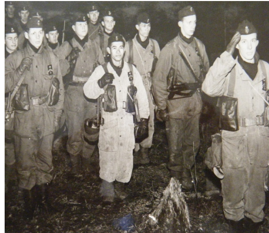
Tillämpad övning i skog och mark