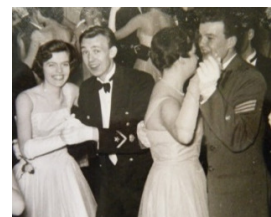
Kadetter dansar också