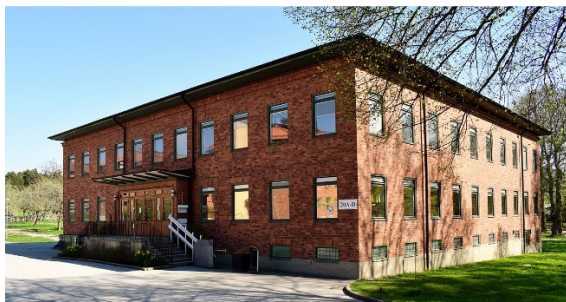
Kadettmatsal med kadettmäss i övervåningen, finns ännu kvar och är nu förskola och hotell

Det hade byggts en skolbyggnad och två kaserner för 240 kadetter i dubbelrum (Fylgia för sjökadetter och Borgen för kustartillerikadetter) och en exercishall.