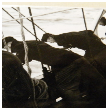
Första riktiga mötet med havet