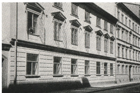
Sjökrigsskolan vid Vallingatan 25 1867 – 1878

Skolan på Skeppsholmen stod klar 1878, där all utbildning till officerare i marinen var förlagd fram till januari 1943, då skolan flyttade till Näsby.