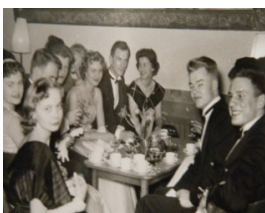
Väntan på nästa dans