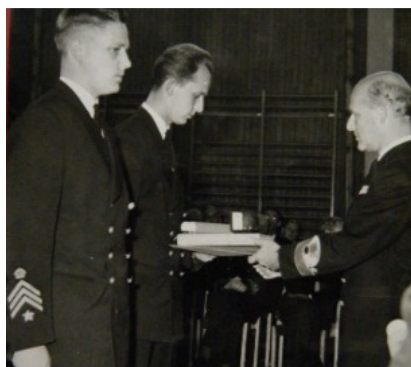
Chefen för Marinen överlämnar officersfullmakt och premier.