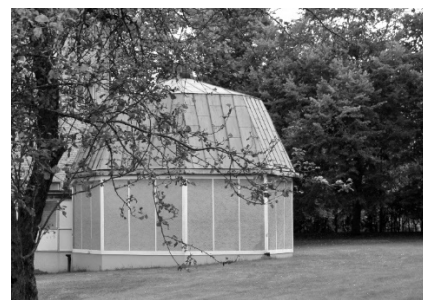
Planetarium i anslutning till skolhuset skänkt av Wallenbergstiftelsen

Vidare hade det byggts en matsals- och mässbyggnad för kadetter, en exercishall samt en idrottshall. Det tillkom senare en uppvärmd simbassäng under ett barracudatält, en ishockeyrink och ett planetarium vid skolbyggnaden samt en korthållsskjutbana.