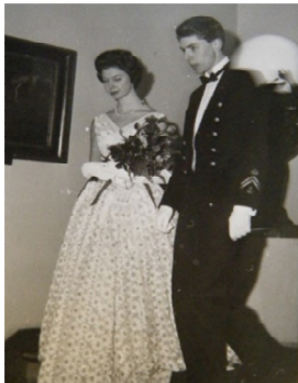
Kadett med Prinsessa

Vidare fick vi en veckas sjötjänstgöring på isbrytare för att få uppleva sjöfartens problem med ishinder men också med radarnavigering. Isflaken ser ut som öar så nu var det annan terrester navigation, som fick övas. Vi fick också uppleva "vett & etikett" med en kadettbal.