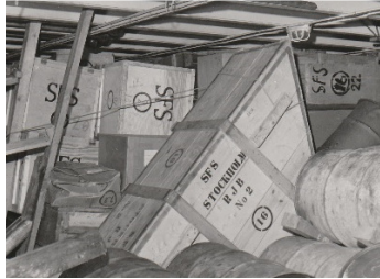
Fullt i minförrådet