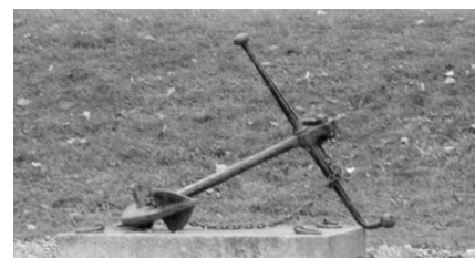
Ankaret som symbol för start och slut på studierna vid skolan (se nedan)