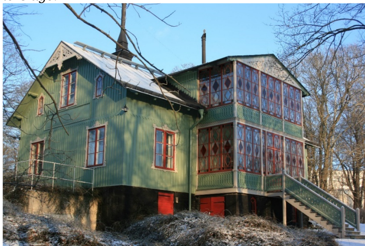
Villa Björkhagen (Törnerska villan), Dag Hammarskjölds väg 3 i Stockholm, var fyrverkare Törners vinterbostad. Foto C-H Ankarberg i januari 2016.