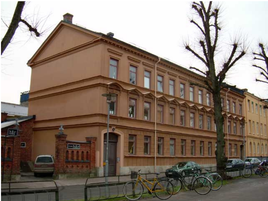
Kv Sirius 5.

1966 byggdes det om till kontor för 3.militärområdesstaben.