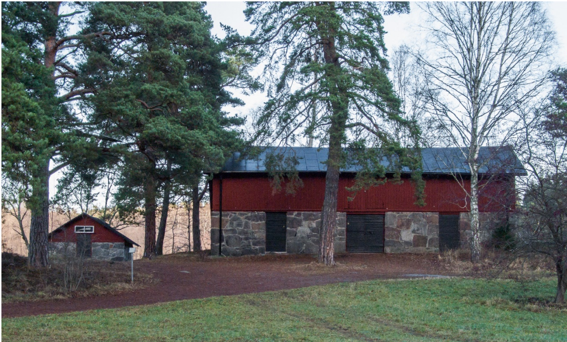
Törners fyrverkerilaboratorium är till det yttre rätt oförändrat av tiden.

Strax intill Stockbysjöns södra strand ligger några rödfärgade byggnader som numera ägs av Lidingö stad. De är låsta med stora hänglås för dörrarna. Husen ligger lite utspridda i terrängen och ser ut att ruva på hemligheter. Under ungefär åttio års tid tillverkades där hantverksmässigt raketer, bengaliska eldar, romerska ljus, bomber och andra fyrverkeripjäser. Det var Sveriges första pyrotekniska fabrik för tillverkning av något som då kallades "lustfyrverkerier".