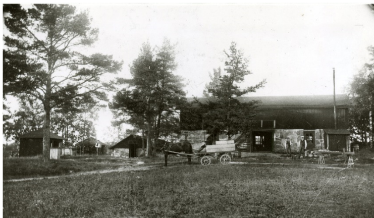
Törners fyrverkerilaboratorium vid Stockbysjön på Lidingö. De lättexplosiva satserna tillverkades för hand i olika små bodar, eller utomhus vid lämplig väderlek.