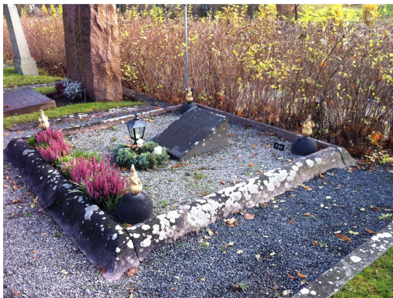
Den Törnerska familjegraven ligger på Lidingö kyrkogård.