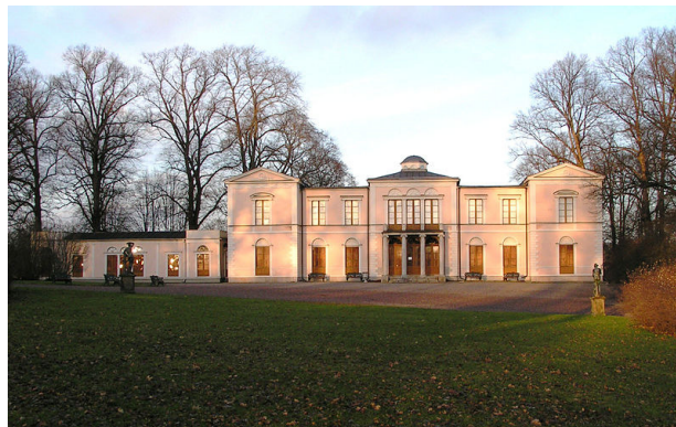
Rosendals slott.

Få arkitekter har som Fredrik Blom satt sin prägel på huvudstaden. Han räknas som den s k Djurgårdsempirens främste företrädare, han ritade Rosendals slott, han ritade eller byggde om flertalet byggnader på Skeppsholmen och Kastellholmen. Han var också ansvarig för mindre iögonfallande, men nog så viktiga byggnadsverk som Blasieholmens stenkajbeläggning med mycket mera.