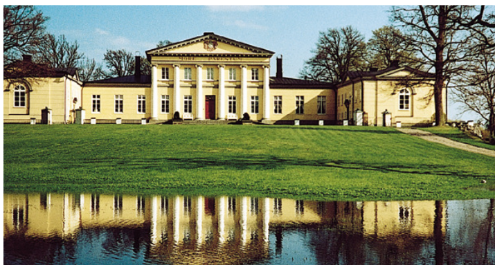
Elghammar slott.