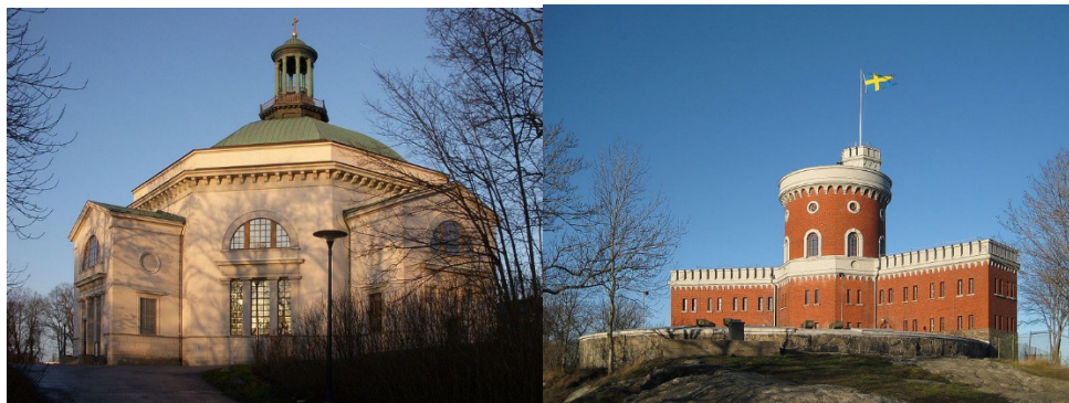
Skeppsholmskyrkan och Kastellet.

I början av 1820-talet blev Blom byggnadschef vid Stockholms örlogsstation och ritade ett stort antal byggnader på Skeppsholmen, Kastellholmen och Galärvarvet. Av dessa kan nämnas Skeppsholmskyrkan, Kastellet, Kasern II och Galärvarvsporten. Ungefär samtidigt blev han kungens privata arkitekt och ritade lustslottet Rosendal, hans kanske förnämsta byggnad. Blom var även verksam vid Rosersbergs slott och Strömsholms slott och sysslade inte bara med arkitekturen utan även med inredningar på dessa kungliga domäner.