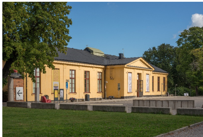
Exercishuset.